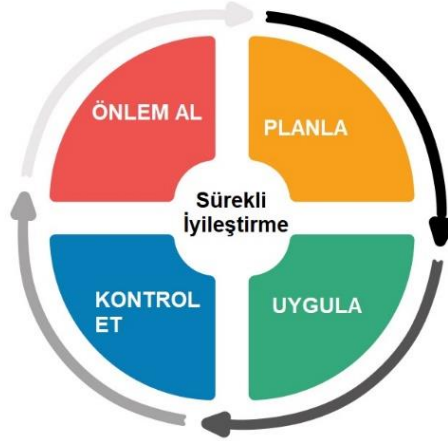
Şekil 1. PUKÖ Döngüsü

Planla: Otelimiz çevre, toplum, kültür, ülke ekonomisi ve yönetim sistemi konularına önem vermekte ve hedefler belirlemektedir. Belirlenen hedeflere ulaşabilmek için izlenecek yol haritası ve eylemleri planlamaktadır.